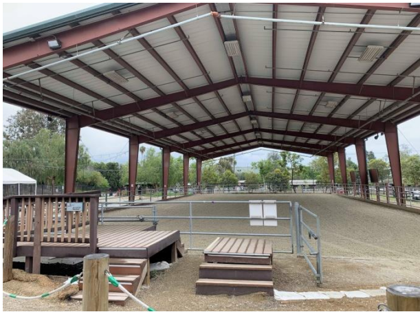
屋根付きの大きな馬場を設備