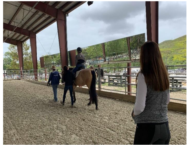
セラピューティックライディングの様子 資格を持ったインストラクターが提供。この時は 手綱操作の練習を行っている。