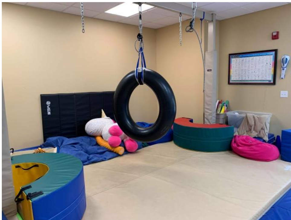
作業療法用のセラピールーム