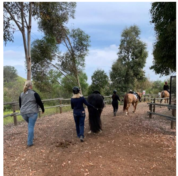
スタッフ向けの実技研修