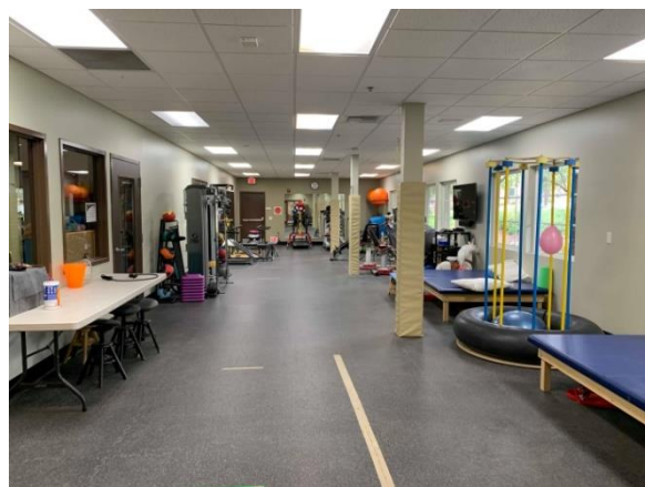
施設内のセラピールーム