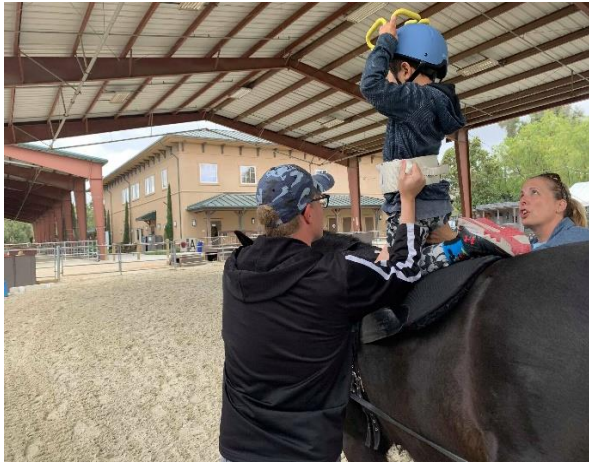
ヒポセラピー（理学療法）の様子 馬上で様々な姿勢を取り、目的とする筋肉 に刺激を与える。