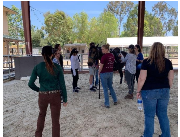
ボランティアに向けた講習の様子 ボランティアの研修を定期的実施。コーディネー ターが在中し、多くのボランティアの配置や情報を 管理している。