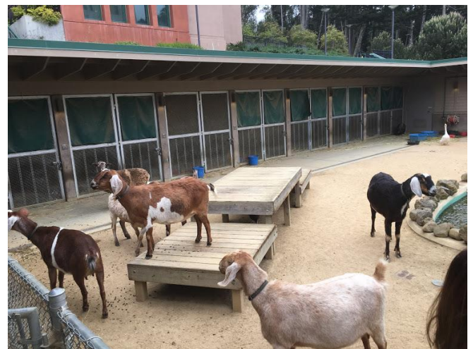
屋外用リハビリ施設、農園、動物の飼育等も