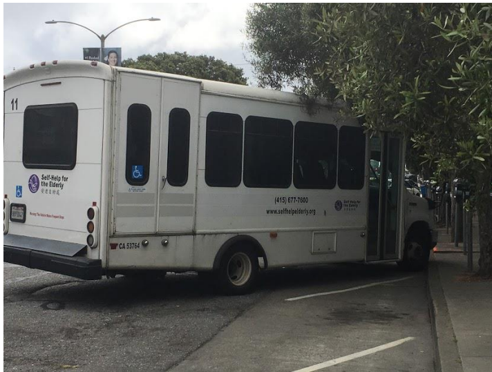
パラ・トランジット（送迎サービス）

中国系のデイケア施設。毎日 70～80 名の高齢者が利用 日本のデイサービスと同じような活動が行われている