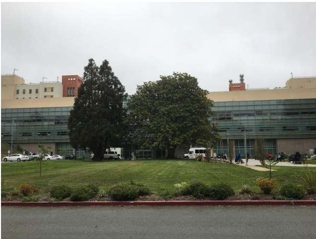
リハビリセンター外景

低所得者の方のためのリハビリセンター。アメリカは医療費が高額なため、病院に入院することが難しい低所得者は、在宅生活を継続する以外の選択肢が少ないため、ここでリハビリをして帰ることになる