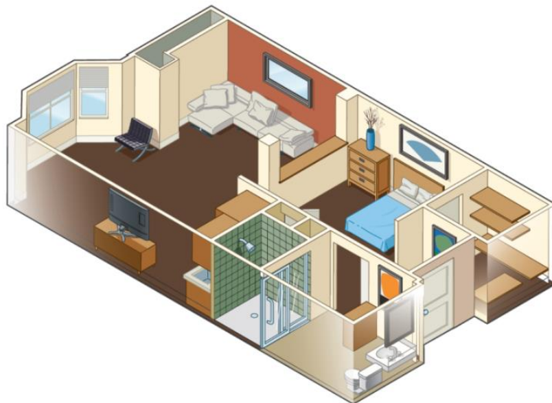
居室のレイアウト