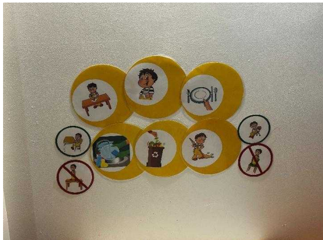
やっぱり大切な、視覚支援（家庭保育（Milieu familial）