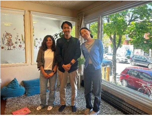
Le jardinurbain の皆さんと一緒に

されていました。「大きな家族として共に育つ」という考え方が根底にあり、保育者が一方的に教育方針を押しつけるのではなく、家庭と協働しながら子どもの育ちを支える姿勢に深い共感を覚えました。視察期間中には「フルーツサラダ作り」プロジェクトが進行しており、子どもたちと一緒に近くの市場へ材料を買いに行くなど、生活と学びが自然に結びついた実践が行われていました。こうした体験型の活動は、子どもたちの主体性や社会性を育むうえで大きな意味を持ち、非常に参考になりました。