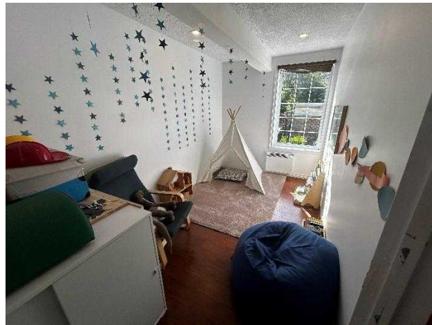
ずっと居たくなるような保育環境（Garderie（民間保育所） Le jardinurbain）