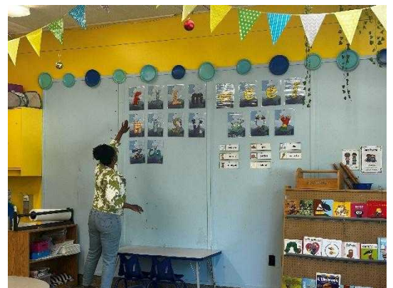
遊びの中で、フランス語の発音確認

また、毎日のルーティンを通して語彙が自然に定着する仕組みが整っており、天気や曜日、感情表現など、生活に密着した言葉が掲示されていました。小グループでの活動が基本だったので、保育者が対話を通して語彙を広げたり、音韻意識を育てたりする場面も多く見られ、個々の発達に応じた支援が行われているように感じました。こうした積み重ねにより、学年末にはほとんどの子どもがフランス語で自然にやり取りできるようになっており、その成長の大きさに驚かされます。