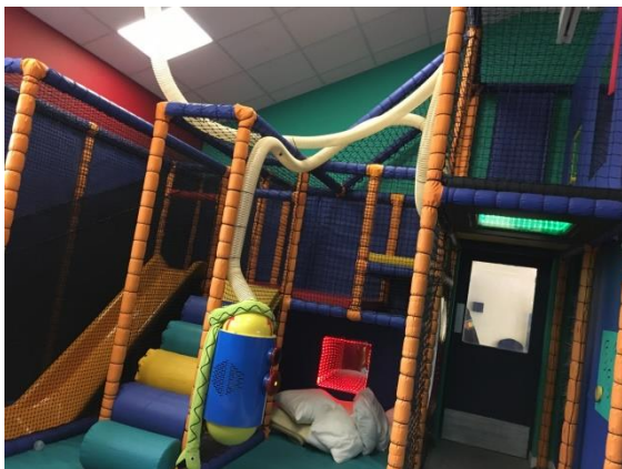
・ Play スペース