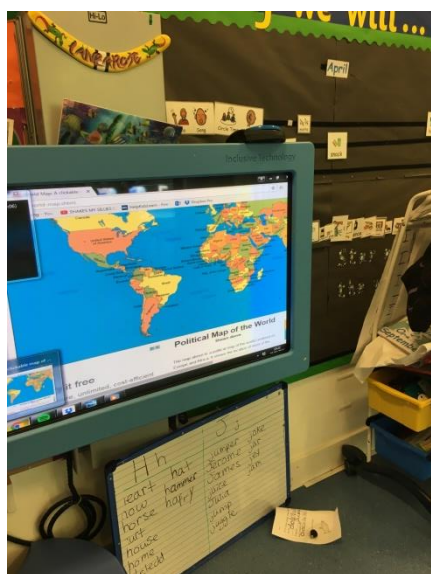
・授業ではモニターを使って興味を引く工夫がされている