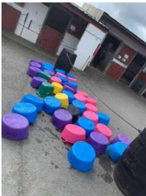
馬小屋の掃除やバケツ洗い