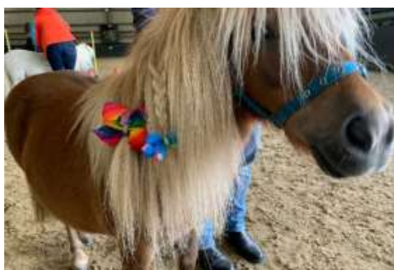
参加者の女の子が飾りつけたポニー