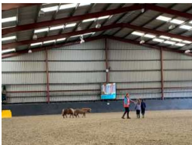
馬の行動観察、距離の取り方について学習

馬との非言語的な相互作用を通して、自尊心や責任感の獲得、チームワークやコミュニケーション、問題解決スキル、リーダーシップについて学ぶことを目的としたプログラム。あらゆる年齢や背景を持った人が対象となり、プログラムの中では馬の行動観察や触れ合い、引馬、馬のたてがみへの飾りつけなど対象者に合わせた活動が行われる。最後には感情を表すフィーリングカードを使用し、その時の自身の感情について、ファシリテーターと共にフィードバックを行う。