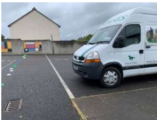
専用の馬運車で小学校へ

学校や精神病院、介護施設など外部の施設に馬を連れていき、馬との触れ合いの機会を提供するプログラム。週に3回ほど行われている。見学時は学校にポニーを連れていき、子供たちが馬との触れ合いや馬のお手入れを楽しんでいた。