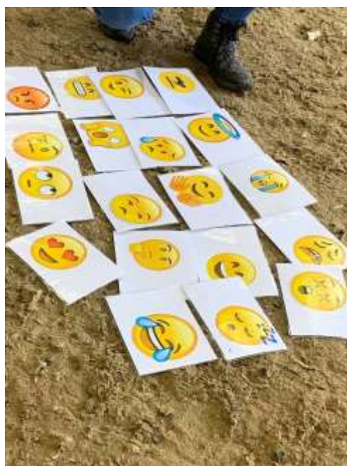
感情を表す絵文字カード