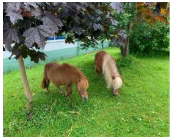
学校の中庭で草を食べるポニーたち 子供たちは数人のグループで交代で馬と触れ合う