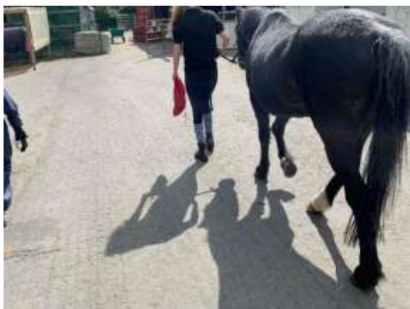
馬を放牧に出す様子

厩舎作業や馬の手入れ、乗馬レッスンのサポートなど馬に関わる作業を行う他、インストラクターの乗馬レッスンを受けるなど、将来、馬の仕事に就くための技術や知識を習得する。