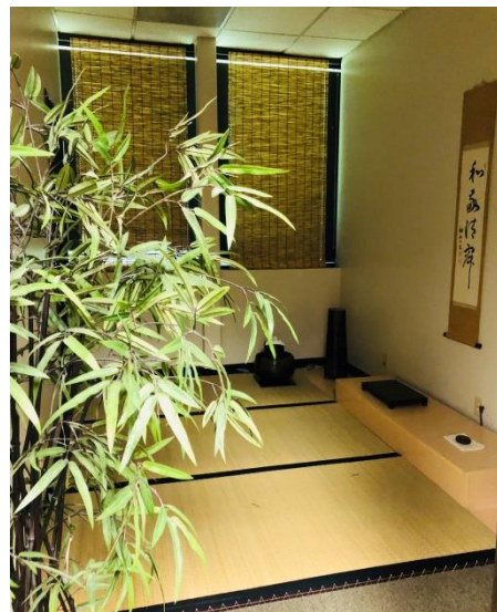
日本の文化！お茶室も

モンテッソリー教育で言われるお仕事 自分で何をするかを選んで、終わったら きちんと棚に戻す