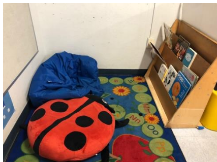
活動をする際は、全体でというよりはコーナーになっており、落ち着いて活動に取り組めるように、少人数が座れるように環境設定されている