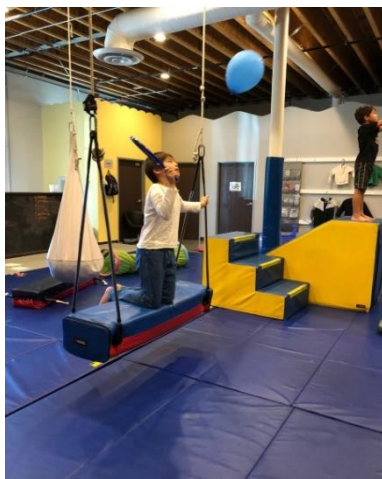
スイングの上でバランスとり