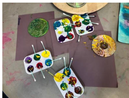
CD に色ぬり、製作コーナー