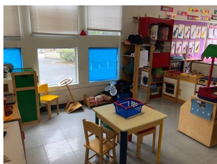
ままごとキッチンコーナー