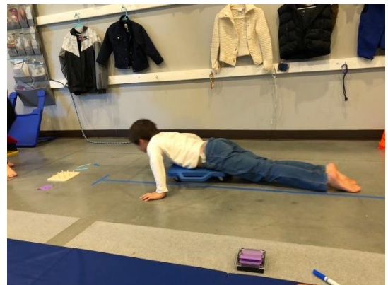
スライドボードを漕いで、アルファベットパズルまで行って組み立てる