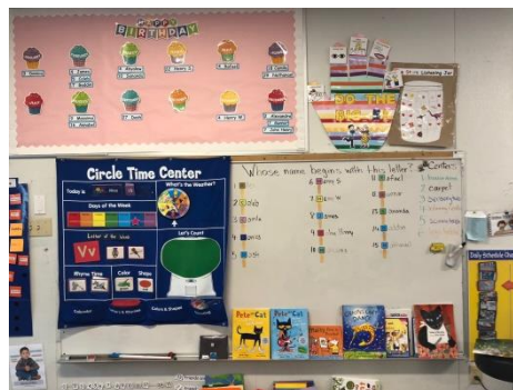
サークルタイムはカリフォルニアの幼児教育課程に従い、文字・数字・色・形などを教える